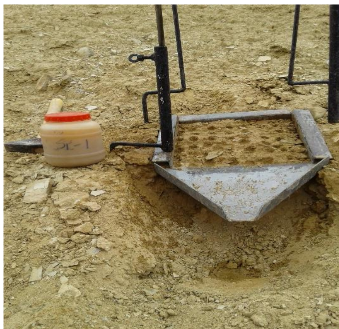
Figure 3: A simulator in the lower red gypsum marl by measuring runoff in the laboratory