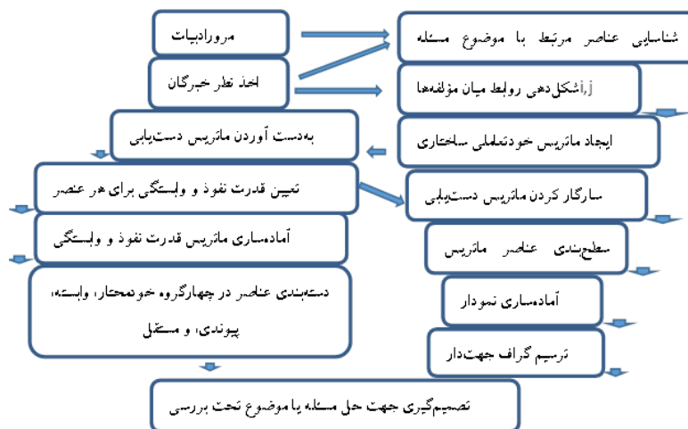
شکل ۱: مراحل اجرایی مدل‌سازی ساختاری-تفسیری

برای تعیین روابط و سطح‌بندی معیارها در مدل‌ساختاری-تفسیری ISM باید مجموعه خروجی‌ها و مجموعه ورودی‌ها برای هر معیار از ماتریس دریافتی استخراج شود. بدین منظور برای کسب اجماع نظر صاحب نظران در رابطه با موضوع حکمرانی خوب آب اقدام به مصاحبه حضوری جهت توضیح راجع به فرآیند تحقیق و نیز ابعاد موضوع مورد مطالعه شد و نیز در خصوص نحوه مقایسه بین مولفه‌ها در داخل پرسشنامه ماتریس گونه مطالب لازم به پاسخگویان عرضه شده و در نهایت با سوال از افراد پاسخگو نسبت به تعیین رجحان هر مولفه نظر نهایی آنها اخذ و در پرسشنامه درج گردید که در ادامه مجموعه دست‌یابی (اثرگذاری یا خروجی‌ها): شامل خود معیار و معیارهایی است که از آن تاثیر می‌پذیرد. مجموعه پیش‌نیاز (اثرپذیری یا ورودی‌ها): شامل خود معیار و معیارهایی است که بر آن تاثیر می‌گذارند. پس از تعیین مجموعه دست‌یابی و مجموعه پیش‌نیاز، اشتراک دو مجموعه حساب می‌شود. اولین مؤلفه‌ای که اشتراک دو مجموعه برابر با مجموعه قابل دست‌یابی (خروجی‌ها) باشد، سطح اول خواهد بود. بنابراین عناصر سطح اول بیش‌ترین تاثیرپذیری را در مدل خواهند داشت. پس از شناسایی شاخص‌های سطح اول، این عناصر حذف شده و فرآیند محاسبه مجموعه دست‌یابی و پیش‌نیاز ادامه پیدا می‌کند. این فرآیند تا حذف تمامی شاخص‌ها ادامه پیدا می‌کند.