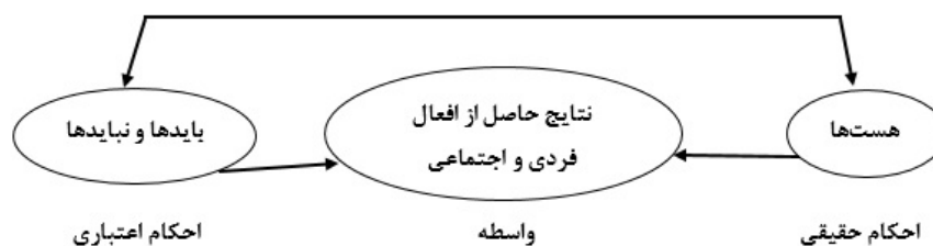
شکل ۲: نسبت میان احکام و گزاره‌های حقیقی و اعتباری (Kamran & Vasegh, 2006:80).

با توجه به مثال‌ها و گزاره‌های ذکر شده و با کمک استدلالی که در خصوص تحویل و تبدیل گزاره‌های وصفی به انشایی و بالعکس مطرح نمودیم، می‌توانیم تصویری کاملاً علمی از علم جغرافیا به‌طور اعم و جغرافیای سیاسی به‌طور خاص؛ بدست دهیم. چرا که گزاره‌های تجویزی جغرافیایی، جزء گزاره‌های اعتباری محض نیستند که با توجه به شخص اعتبارکننده، متغیر و نسبی باشند بلکه از نوع گزاره‌های تجویزی یا اعتباریاتی عقلی است که ناشی از رابطهٔ علی بین دو طرف قضیه است لذا این گزاره‌ها کاملاً گزاره‌هایی علمی بوده و قابلیت صدق و کذب دارند و به تعبیر دیگر، نسبی نیستند. می‌توان چنین نتیجه گرفت که بسیاری از احکام اعتباری و باید و نبایدهای اخلاقی، حقوقی، دینی، سیاسی، اقتصادی و نظایر آن‌ها مبتنی بر مصالح و مفاسد و آثار واقعی اعمال و افعال بوده و نوعی ضرورت قطعی و واقعی میان اعمال و نتایج مترتب بدان‌ها وجود دارد و قواعد اخلاقی و اعتباری در حقیقت صرفاً به معنای جعل ضرورت‌ها و باید و نبایدها نیست بلکه معادل کشف ضرورت و روابط حقیقی میان افعال با نتایج آن‌هاست. بنابراین جملات انشایی در اخلاق، حقوق و «سیاست» حاکی از رابطهٔ بایدها با هست‌ها نیست بلکه رابطهٔ «هست‌ها و هست‌ها» و رابطهٔ بین «اخبار با اخبار» است. بدین ترتیب ما با واسطه قرار دادن نتیجهٔ افعال که «واقعیتی بیرونی» میان فعل و فاعل است ضرورت انجام فعل از سوی فاعل را نتیجه می‌گیریم و این ضرورت، معنایی «عقلی و حقیقی» یافته و از چارچوب انشایی، مجازی، جعلی و ذوقی خارج می‌گردد (Kamran & Vasegh, 2006:80-81). این مطلب را می‌توان به شکل نمودار زیر نشان داد: