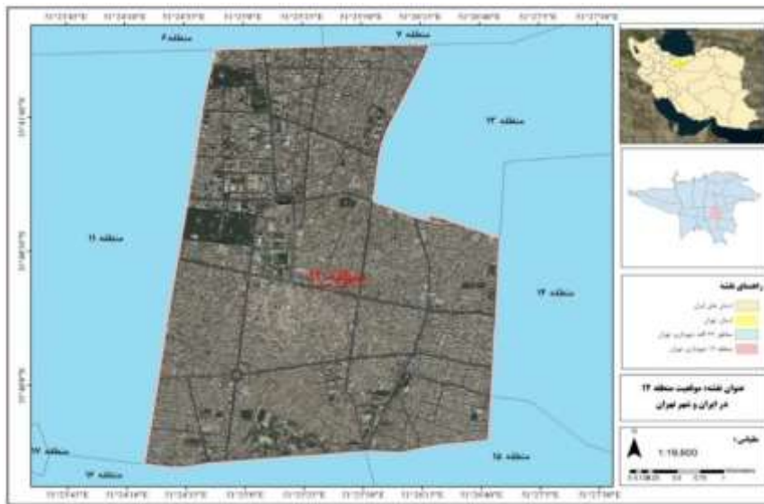
شکل ۲: نقشه موقعیت منطقه ۱۲ شهر تهران.

منطقه ۱۲ تهران با جمعیت ۲۴۱۸۳۱ نفر، ۳/۱۷ درصد از کل جمعیت تهران را به خود اختصاص داده است (شکل ۲). این منطقه با وسعت ۱۶۰۱/۷ هکتار، ۲/۳۰ درصد مساحت کل تهران را دارا است و یکی از قدیمی‌ترین مناطق تهران است که در بین مناطق ۲۲ گانه تهران دارای بیش‌ترین میزان بافت‌های ناکارآمد است. این منطقه از نظر تراکم جمعیتی در رتبه دوم مناطق شهر تهران قرار دارد و شامل ۶ ناحیه و ۱۳ محله است (Iran Statistics Center, 2016).