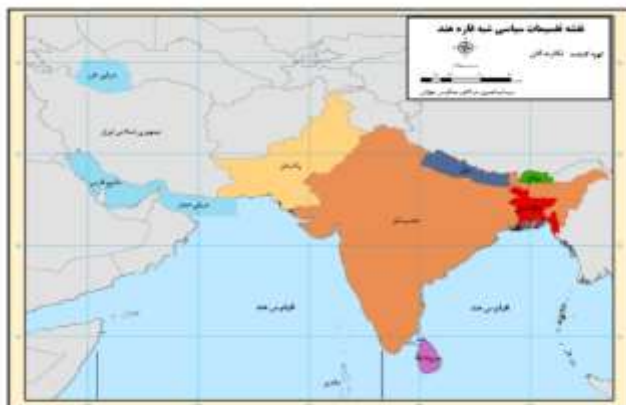
شکل ۱: نقشه سیاسی جنوب آسیا Figure 1: Political map of south Asia

همه ملت های جنوب آسیا با مناطق مجاور ارتباط دارند بوتان، هند و نپال با شمال شرق آسیا با توجه به مرز مشترک آن ها با چین تحت کنترل تبت، ارتباط دارند. مالدیو که عملا در اقیانوس هند واقع شده است با کشورهای جزیره ای کوچکی مانند موریس و سیشل ارتباط دارد و به ظاهر دارای اشتراکات بیش تری با آن ها هست. پاکستان از طریق مرز خود با ایران، ارتباط فیزیکی با جنوب غربی آسیا دارد. سرانجام، هند و بنگلادش در نتیجه مرزهای خود با میانمار، با جنوب شرقی آسیا ارتباط دارند. علاوه بر این، هند به دلیل در اختیار داشتن جزایر آندامان و نیکوبار که قلمرو دریایی آن به مراتب نزدیک به میانمار و تایلند است به خوبی می تواند بخشی از جنوب شرقی آسیا در نظر گرفته شود (Snedden, 2016: 3-10) از لحاظ تاریخی، تمام کشورهای جنوب آسیا دارای پیوند با استعمار انگلیسی هستند مناطقی که از ملت های بنگلادش، هند، پاکستان و سریلانکا (قبلا سیلان) تشکیل شده بودند، به طور مستقیم یا غیرمستقیم توسط بریتانیایی ها اداره می شدند. بوتان و مالدیو، تحت الحمایه بریتانیا بودند. بریتانیا مستقلا نپال را کنترل نمی کرد اما سیاست های دفاعی و خارجی را بر عهده داشت (Snedden, 2016: 3-10). جنوب آسیا چند دهه منازعات را از جنگ جهانی دوم به بعد به دوش کشیده است (شکل ۲). بعضی از آن ها نتیجه میراث به جا مانده از دوره استعمار و حتی قبل از دوره استعمار و برخی دیگر (بیش تر آن ها) به علت مسائلی که در سال ۱۹۴۷ م (بعد از تقسیم شبه قاره هند) رخ داده است سرچشمه گرفته اند (Johnson, 2005: 7).