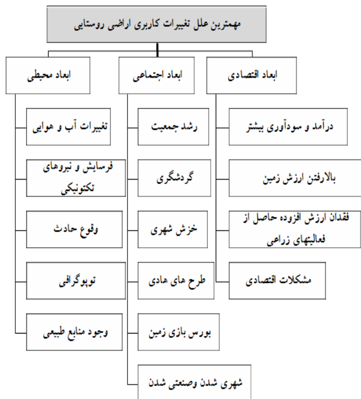
شکل ۱: مهم‌ترین عوامل تغییر کاربری اراضی روستایی

تغییرات تکنولوژیک، توسعه حمل و نقل، ظهور سیستم‌های دولتی، سیاست‌گذاری و بروز تفکرات مصرف‌گرایی موجب پیدایش انواع مختلف گردشگری و تفریح شده است که این امر منجر به بروز تغییرات کاربری اراضی می‌شود (Motiee Langeroodi et al., 2012). در کشورهای در حال توسعه، بورس‌بازی زمین مهم‌ترین عامل تغییرات اراضی کشاورزی می‌باشد که تحت تاثیر عوامل بیرونی مانند تصمیمات سیاسی، تغییر در استانداردهای زندگی، تغییر در فناوری، تاثیرات نیروهای بازار و فشار توسعه شهر بوده است (Zia Tavana & Amir Entkhabi, 2008). در کشورهای صنعتی سیاست‌های حمایتی از بخش کشاورزی با اعطاء یارانه‌ها و بستن بازارهای داخلی در مقابل واردات اعمال می‌شود که مانع تغییر کاربری اراضی است. همچنین دو پدیده خوردنگی و خزش شهری نیز عوامل تعیین‌کننده‌ای هستند که با دست‌اندازی کانون‌های شهری به اراضی کشاورزی و روستایی پیرامونی در ارتباط تنگاتنگ قرار دارد. لذا نفوذ کاربری‌های شهری به فضاهای باز روستایی، اغلب فضاهای باز را به‌طور بالقوه برای تولید مسکن و کاربردهای جانبی قابل توسعه ساخت؛ بنابراین ارزش فروش زمین به‌منظور کاربری‌های مزبور از ارزش زمین به‌منظور کاربری‌های سنتی بیشتر شد (Afrakhteh, 2008). بر این اساس می‌توان عوامل موثر بر تغییر کاربری اراضی را به‌طور عام و صرف‌نظر از موقعیت منطقه‌ای خاص در ابعاد مختلف اقتصادی، محیطی و اجتماعی دسته‌بندی کرد (شکل ۱).