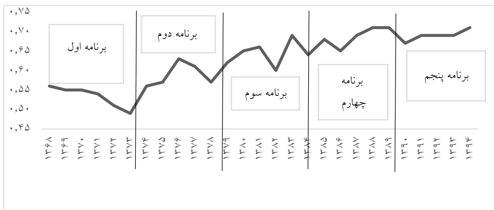
شکل ۶: روند شاخص فقر آب برای دوره ۱۳۶۸ تا ۱۳۹۴ Figure 6: The trend of water poverty for the period 1989-2015

مقایسه شاخص "نسبت وابستگی به منابع آب خارجی" در ایران و کشورهای دیگر نشان می‌دهد که منابع آب وارد شده از کشورهای هم جوار تحت تأثیر موقعیت جغرافیایی آن‌ها متفاوت است. وابستگی کشورها به منابع آب کشورهای همسایه یکی از دلایل اصلی نزاع بر سر آب بوده است. طبق گزارش‌های سازمان ملل در نیم قرن اخیر، بیش از ۱۸۳۰ مورد مناقشه در زمینه آب در جهان رخ داده که ۳۷ مورد آن سبب بروز جنگ و یا انفجار شده است. در منطقه خاورمیانه و قاره آفریقا کشورهای مصر، سودان و اتیوپی بر سر تقسیم آب رود نیل و کشورهای عراق، سوریه، ترکیه و ایران بر سر رودهای دجله و فرات تنش‌های جدی دارند. میزان وابستگی ایران به منابع خارجی در سطح نسبتاً پایینی قرار داشته و حدود ۷ درصد از منابع آب ایران از منابع خارجی تأمین می‌شود. هر چند شاخص وابستگی کشور به منابع آب ورودی از کشورهای همسایه در سطح پایینی قرار دارد، اما محدودیت منابع آب در شرق کشور سبب شده است که اختلافات جدی بین ایران و افغانستان در خصوص میزان بهره‌مندی از آب رودخانه هیرمند که از افغانستان سرچشمه می‌گیرد، وجود داشته باشد.