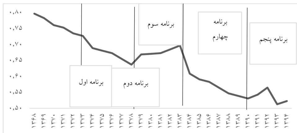
شکل ۲: روند شاخص منابع آب برای دوره ۱۳۶۸ تا ۱۳۹۴

استفاده از آب های زیرزمینی در آبیاری و استفاده از آب کانال ها را شامل می شود. مدیریت تقاضای آب شامل مواردی نظیر اصلاح الگوی مصرف در بخش های مختلف مصرفی، تغییرات نهادی، اصلاحات سازمانی و مشارکت مصرف کنندگان در امر مدیریت منابع آب را شامل می شود. اگر الزامات سیاستی برای حمایت از بخش آب تقویت نشود، بحران آب به بدتر شدن خدمات آب رسانی برای میلیون ها نفر، کاهش اراضی کشاورزی، کاهش تولید مواد غذایی، افزایش سریع قیمت مواد غذایی و کاهش مصرف سرانه مواد غذایی منجر خواهد شد. عدم توجه به توسعه تکنولوژی، ذخیره سازی منابع آب و اصلاحات سیاستی ممکن است تقاضای آب برای مصارفی به غیر از کشاورزی را حتی با سرعتی بیشتر از آنکه پیش بینی شده است، افزایش دهد، که در این صورت موجب بدتر شدن وضعیت منابع آب و تشدید بحران آب خواهد شد.