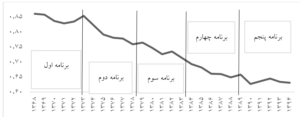
شکل ۱: روند شاخص تمامیت زیست محیطی برای دوره ۱۳۶۸ تا ۱۳۹۴