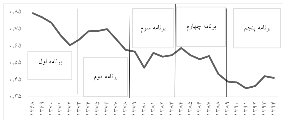
شکل ۳: روند شاخص دسترسی به آب برای دوره ۱۳۶۸ تا ۱۳۹۴

ایران با میانگین بارندگی سالانه ۲۲۸ میلی‌متر در مقابل ۸۱۳ میلی‌متر متوسط بارندگی سالانه کره زمین در مجموع یکی از کشورهای خشک جهان محسوب می‌گردد. خشک‌سالی در کشورهای نظیر ایران که با مساله کم‌آبی و کاهش نزولات جوی رو به رو است، هر چند سال یک بار رخ می‌دهد و بخش‌های وسیعی از ایران به علت وقوع شدن در قلمرو اقلیمی خشک و نیمه خشک همواره بارش کمی دریافت می‌کنند و از این رو به طور دائم با کمبود آب مواجه هستند. یکی از مهم‌ترین ویژگی‌های اقلیمی نواحی خشک ایران تغییر شدید در رژیم بارش آن است.