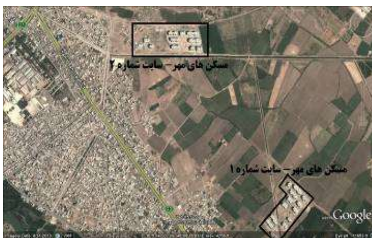
شکل ۳: قرار گرفتن مسکن‌های مهر بر روی زمین‌های حاصلخیز کشاورزی

همچنین مجتمع‌های مسکن مهر میاندوآب بر روی حاصلخیزین و بهترین خاک‌های کشاورزی از نظر زراعی مکان‌گزیده‌اند که بیانگر ناسازگاری کامل کاربری اراضی زارعی و محیط ساخته شده است. هر دو سایت مسکن مهر این شهر در داخل و در مجاورت باغات و اراضی کشاورزی احداث شده‌اند (شکل ۳) که این موضوع نه تنها موجب از بین رفتن اراضی کشاورزی و پایین آمدن راندمان تولیدی محصولات زراعی باتوجه به غالبیت فعالیت کشاورزی در این شهرستان می‌شود، بلکه در چند سال آینده تهدیدی برای زمین‌های مجاور این مجتمع‌ها محسوب می‌گردد. چرا که اینگونه اراضی که جهت الحاق به اراضی شهری و کسب سود بیش‌تر برای مدت کوتاهی بلااستفاده می‌مانند و در نهایت با رشد پراکنده شهر و قرارگرفتن در محدوده قانونی شهر به کاربری‌های شهری تغییر می‌یابند.