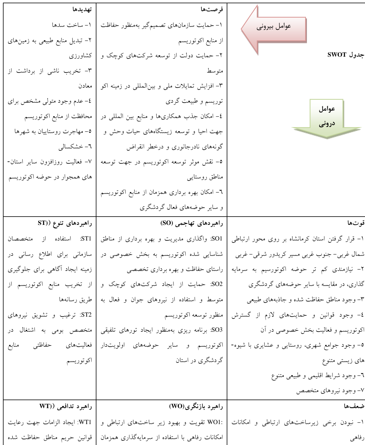
جدول ۳- ماتریس SWOT برای استخراج استراتژی های ممکن

استراتژی قوت -فرصت (SO)، ضعف-فرصت (WO)، قوت-تهدید (ST) و ضعف-تهدید (WT) در جدول (۳) قرار گرفته اند.