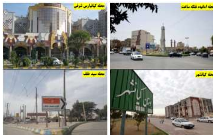
شکل ۲: برخی از محلات منطقه ۲ کلان‌شهر اهواز

Figure 2: Some neighborhoods of region Two Metropolitan Ahvaz