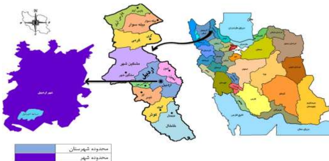
شکل ۱: موقعیت شهر اردبیل در استان و کشور Figure 1: Location of the Ardebil city in province and country

شهر اردبیل مرکز استان اردبیل در شمال غربی کشور و در موقعیت جغرافیایی ۳۸ درجه و ۱۵ دقیقه عرض شمالی و ۴۸ درجه و ۱۷ دقیقه طول شرقی واقع شده است (Statistical Center of Iran, 2017). شکل (۱) موقعیت شهر اردبیل را در سطح کشور، استان و شهرستان اردبیل نمایش می‌دهد.