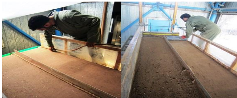
شکل ۲: آماده‌سازی خاک و فلوم در آزمایشگاه شبیه‌ساز باران و فرسایش

قبل از انجام آزمایش، بستر فلوم باید آماده شود که این آماده‌سازی شامل دو مرحله زیرسازی و روسازی فلوم است. در مرحله زیرسازی با ذرات ماسه‌ای درشت دانه یا گراول با اندازه بین ۱ تا ۲ سانتی‌متر لایه‌ای به‌عنوان زهکش به ضخامت ۵ سانتی‌متر در کف فلوم ایجاد شد. همچنین به‌منظور افزایش اصطکاک در مرز خاک و جداره فلوم، یک ریسمان کنفی در دیواره‌ی فلوم نصب شد که مانع افزایش سرعت روان آب و ایجاد شیار در مرز خاک و جداره شیشه‌ای می‌شود. در این قسمت برای در نظر گرفتن تکرار در هر آزمایش، فلوم توسط ورقه‌های فلزی به دو قسمت مساوی تقسیم شد (شکل ۲).