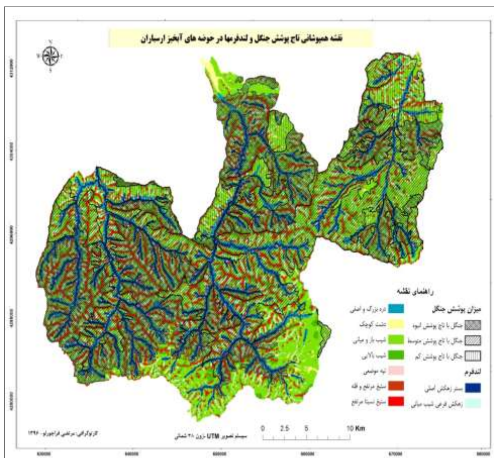
شکل ۲: نقشه همپوشانی طبقات تراکم جنگل با طبقات لندفرمی در حوضه‌های آبخیز ارسباران

رابطه منفی پارامتر ارتفاع با فراوانی پوشش گیاهی را در حوضه‌های آبخیز مورد مطالعه می‌توان به عوامل مختلفی نسبت داد: اول این‌که خاک‌های مرتفعات عمدتاً خاک‌های کم‌عمق با سنگ بستر نزدیک به سطح زمین هستند که به‌شدت ظرفیت کل نگهداشت آب را محدود می‌سازند (Iverson et al, 1997: 337). دوم این‌که ممکن است با افزایش ارتفاع به دلیل گسترش جمعیت روستایی و عشایری، با تخریب بیش‌تری مواجه شویم (Mirzaeizadeh & Niknejad, 2013: 102). سوم و شاید مهم‌تر از همه این‌که فرم‌اسیون گیاهی غالب منطقه، جنگل بوده و جنگل‌های خوب عمدتاً در ارتفاعات میانی واقع شده‌اند. در همین راستا نتایج هم‌پوشانی طبقات تاج پوشش جنگلی با طبقات لندفرم‌ها (شکل ۲) نیز نشانگر این بود که قسمت عمده جنگل‌ها مربوط به شیب‌های باز ارتفاعات میانی هستند. نقشه مربوط نشان داد که حدود ۴۰ درصد جنگل‌های انبوه، ۶۶ درصد جنگل‌های نیمه‌انبوه و ۵۰ درصد جنگل‌های تنک در طبقه لندفرمی شیب باز میانی واقع شده‌اند. به هر صورت نتیجه حاصل در مغایرت با نتایج محققانی چون (Deng et al (2007)؛ Zaremehrijardi et al (2007)؛ Taghipour & Rastgar (2010) بوده و در مقابل با نتایج (Ghorbanli et al (2015)؛ Spadavecchia et al (2008) مطابقت دارد.