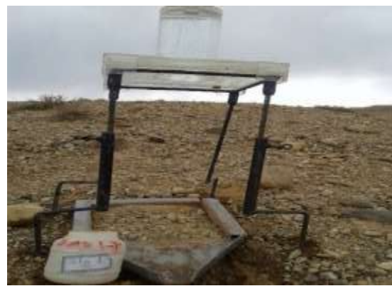
شکل ۲: دستگاه شبیه‌ساز باران در واحدهای کاری غیر مارنی (راست) و مارنی (چپ)