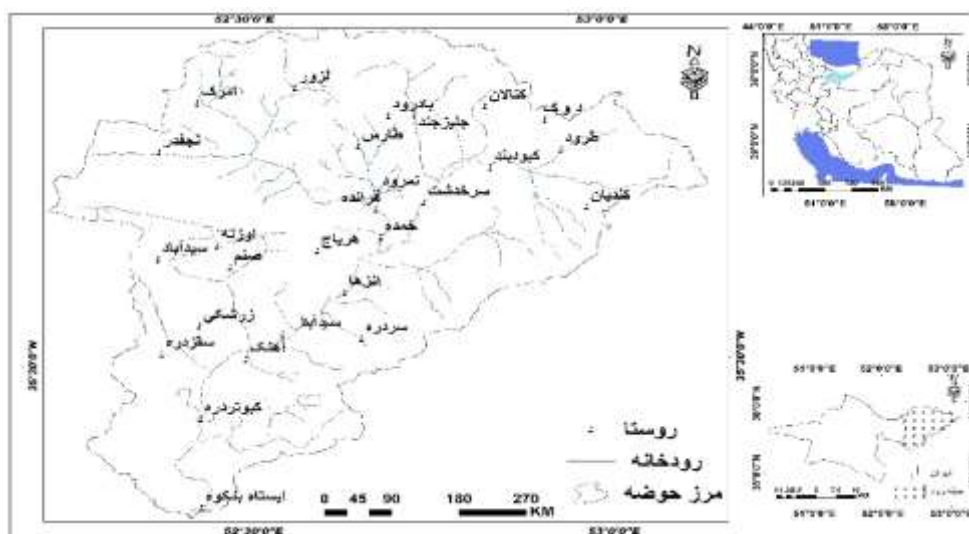
شکل ۱: نقشه موقعیت جغرافیایی منطقه تحقیق و حوضه حبله رود

بلندترین نقطه ارتفاعی این حوضه ۴۰۰۳ متر و حداقل ارتفاعی آن ۱۰۰۰ متر از سطح دریا است. واحدهای زمین‌شناسی این حوضه در محدوده زمانی پرکامبرین تا کواترنری قرار دارند و مربوط به سازندهای کهر، بایندر، زایگون، لالون، مبارک، الیکا، شمشک، دلیچای، لار، تیزکوه، فاجان، زیارت، کرج، کند، قرمز تحتانی، قم، قرمز فوقانی، کهریزک، آبرفت تهران و سنگ‌های ولکانیکی دوره چهارم می‌باشد. سنگ‌شناسی غالب شامل آهک، مارن، شیل و ماسه‌سنگ، توف و آبرفت است.