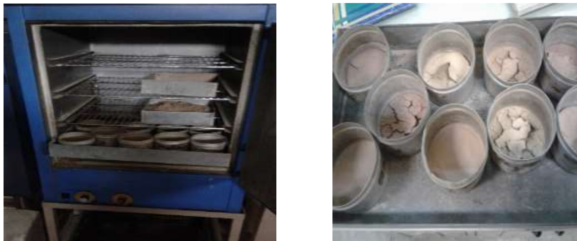
شکل ۳: خشک نمودن و توزین رسوب نمونه‌ها در آزمایشگاه

با تعمیم نتایج باران‌ساز (شکل ۳) از سطح دامنه‌ها به سطح زیرحوضه‌ها نشان داد که حداکثر رسوب ویژه ۴/۳ تن در هکتار و متوسط ۱/۶۷ تن در هکتار برای کل حوضه در اثر یک واقعه بارش می‌باشد (شکل ۴).