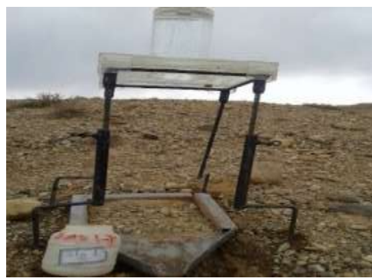
شکل ۲: دستگاه شبیه‌ساز باران در واحدهای کاری غیر مارنی (راست) و مارنی (چپ)