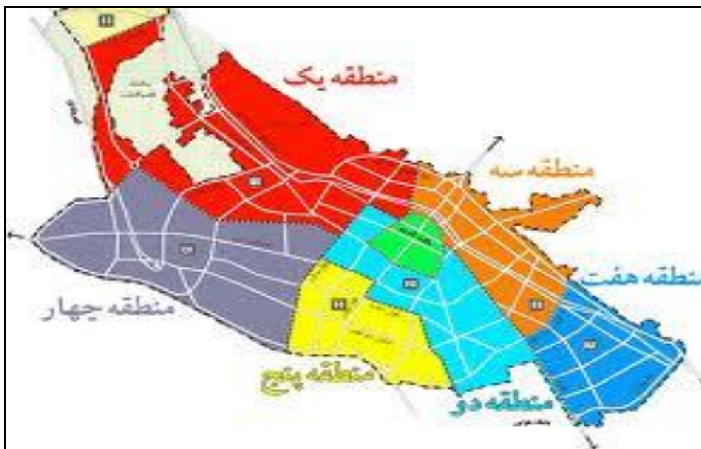
شکل ۳: محدوده مناطق مورد مطالعه شهر شیراز