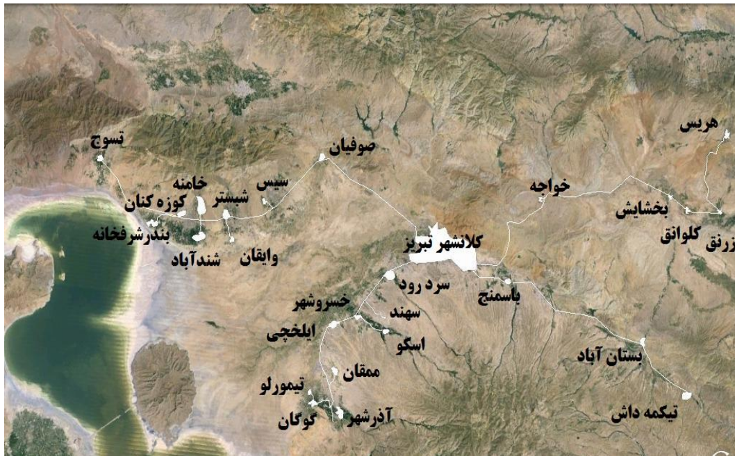
شکل ۱: نقشه موقعیت جغرافیایی و سیستم شهری-منطقه‌ای مربوط به منطقه کلانشهری تبریز

سطوح توپوگرافی بین ۱۳۰۰ الی ۱۷۵۰ متری به صورت طولی استقرار یافته است. این شهر در محدوده عرض‌های جغرافیایی ۳۶ درجه؛ نه دقیقه الی ۳۸ درجه و یک دقیقه طول‌های شرقی ۴۸ درجه و ۲۳ دقیقه الی ۴۶ درجه و ۱۱ دقیقه با ارتفاع متوسط ۱۳۴۰ متر از سطح آب‌های آزاد در سطح جلگه‌ای به همین نام واقع شده و در حال توسعه است (عابدینی و همکاران، ۱۳۹۱: ۲۵۱).