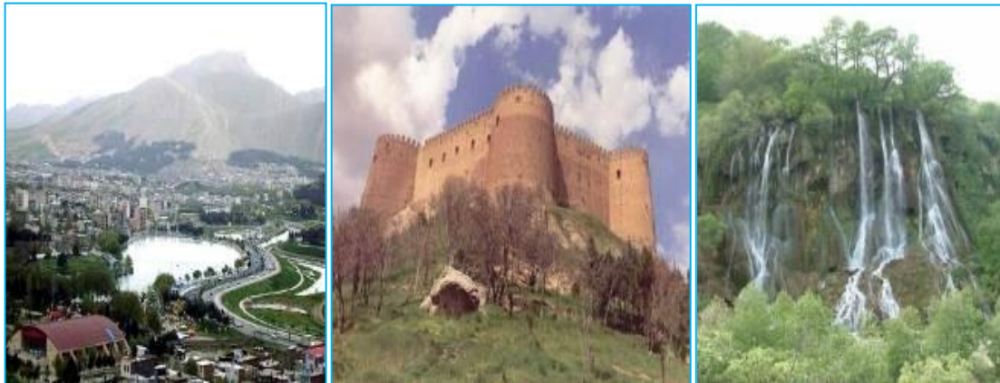
دریاچه کیو و نمایی از آن