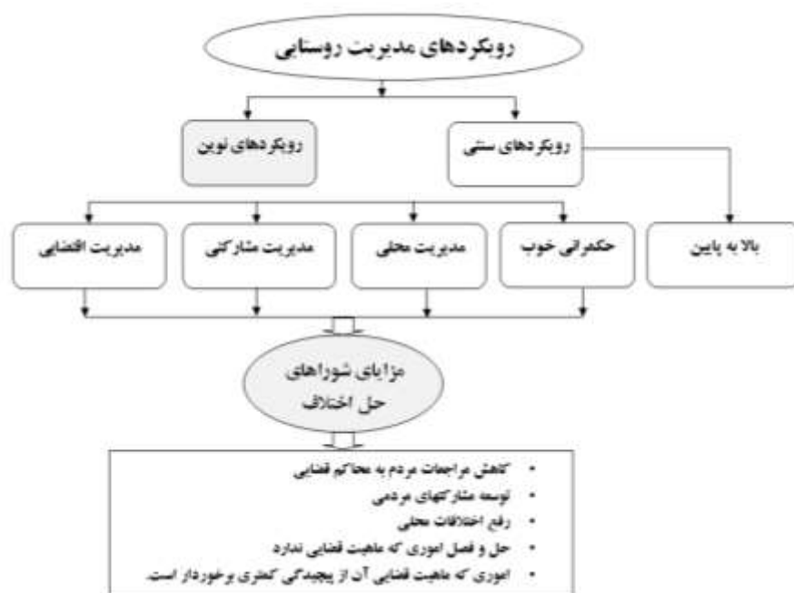
شکل ۱: شورای حل اختلاف، اهمی در راستای تحقق رویکردهای نوین مدیریت روستایی

از مزایای به‌کارگیری مدیریت محلی تاکید بر افزایش مشارکت مردم محلی می‌باشد که از زمره شاخص‌های دستیابی به حکمروایی مطلوب در فضاهای روستایی به‌شمار می‌آید که شوراهای حل اختلاف با تامین این شرایط به حضور و مشارکت مردم و همچنین استفاده از پتانسیل‌های محلی فضاها برای مدیریت و توسعه آن‌ها گام برداشته‌اند (Puglies, 2001: 14) (شکل ۱).