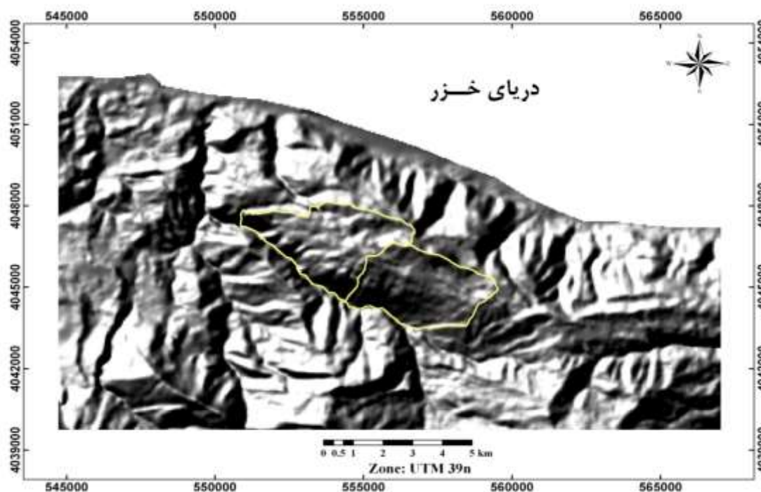
شکل ۱: موقعیت منطقه مورد مطالعه در نقشه پستی و بلندی منطقه

در این تحقیق از داده‌های سنجنده TM ماهواره لندست ۵ به شماره‌گذر ۱۶۵ و ردیف ۳۵ مربوط به تاریخ ۲۰ مرداد ماه سال ۱۳۹۰ هجری شمسی (۱۱ آگوست ۲۰۱۱ میلادی) و از نقشه‌های دو بعدی (2D) برای کنترل کیفیت هندسه تصاویر ماهواره‌ای استفاده شد. برای تجزیه و تحلیل رقومی، پردازش تصاویر ماهواره‌ای، از نرم‌افزار Idrisi Taiga برای استخراج مختصات قطعات نمونه برداشت شده از نرم‌افزار MapSource، برای طراحی و انطباق قطعات نمونه و قرائت نقشه‌ها از نرم‌افزار ArcGIS 9.3 و Arcview3.2a، برای تجزیه و تحلیل آماری داده‌ها و رسم نمودارها از نرم‌افزارهای Microsoft Excel و SPSS Ver20 استفاده شد.