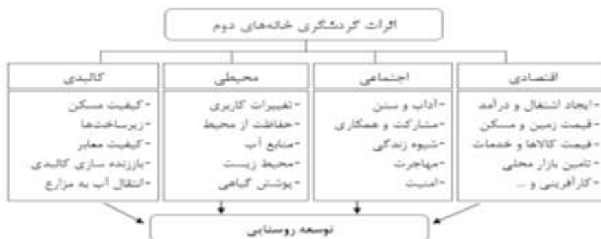
شکل ۱: مدل مفهومی اثرات گردشگری خانه‌های دوم در مناطق روستایی