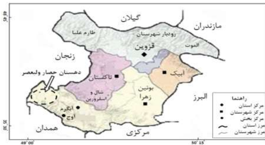
شکل ۲: موقعیت منطقه مورد مطالعه در استان قزوین