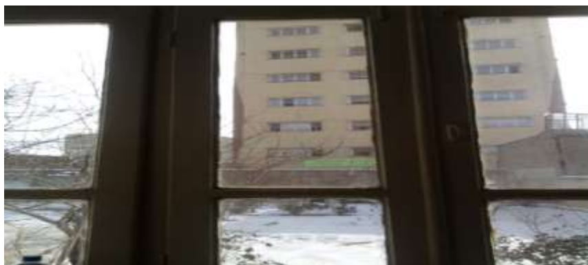
شکل ۲: تصویر ساختمان بلندمرتبه از حیاط یک خانه قدیمی

در ارتباط با آرامش روحی و روانی خانواده‌ها در مجاورت ساختمان‌های بلندمرتبه مشاهدات نشان می‌دهد که در مناطق مرکزی شهری به دلیل اینکه بافت شهر قدیمی می‌باشد اکثر خانه‌ها دارای حیاط بزرگ و پنجره‌های باز رو به حیاط می‌باشند، عادت عمومی مردم، وابستگی آن‌ها به فضای سبز حیاط خانه را نشان می‌دهد. ساخت ساختمان‌های بلندمرتبه در مجاورت محل سکونت آن‌ها، آرامش ساکنان در دسترسی به حیاط خانه و حتی آرامش داخل اتاق‌های خانه را مختل کرده است. بررسی موقعیت مکانی تعدادی از ساختمان‌های بلندمرتبه نشان می‌دهد که در آن‌ها با وجود تنگ بودن عرض کوچه‌ها و زیاد بودن تعداد طبقات ساختمان، ضوابط و معیارهای شهرسازی و معماری از جمله اشرافیت، تراکم و تفکیک طبقات، گذربندی و ایجاد پارکینگ به طور کامل رعایت نگردیده است و یا در صورت رعایت موارد فوق، به دلیل اینکه بافت شهر قدیمی می‌باشد هنوز آمادگی ساختاری، فرهنگی و اجتماعی لازم برای کنار آمدن با این موضوع در خانواده‌ها وجود ندارد. لذا همین مسائل یکی از دلایل اصلی در نارضایتی ساکنان این مناطق از احداث ساختمان‌های بلندمرتبه می‌باشد. در شکل ۲ تصویر یکی از ساختمان‌های بلندمرتبه از داخل اتاق یکی از ساختمان‌های مجاور نشان داده شده است که خود تصویر گویایی از مسائل پیش‌آمده می‌باشد.