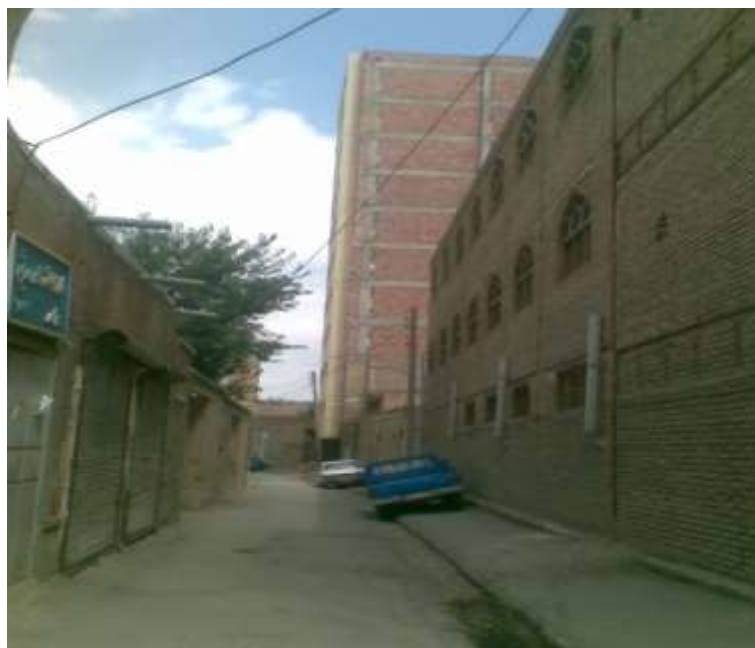
شکل ۳: تصویری از یک ساختمان بلندمرتبه و کوچه مشرف به آن

وجود ندارد و یا با پرداخت جریمه در ساخت وسازهایی با پروانه خلافی‌ها، قابل حل و فصل می‌باشد در بیشتر موارد، قوانین و ضوابط مربوط به گذر بندی در این مناطق رعایت نشده است در ضمن در صورت رعایت قوانین گذر بندی به دلیل بافت قدیمی کوچه‌ها و خیابان‌ها، بعضی ساختمان‌های تازه‌ساز عقب‌کشی لازم را انجام داده‌اند در حالی که ساختمان کناری متروکه بوده و یا هنوز با همان ساختار قدیمی استفاده می‌شود و عقب‌کشی در آن‌ها انجام نشده است. لذا رفت و آمد خودروها به دشواری در آن‌ها صورت می‌گیرد. شکل ۳ تصویر یکی از ساختمان‌های بلندمرتبه را از سمت کوچه کناری نشان می‌دهد. چنانچه از تصویر استنباط می‌شود کوچه مشرف به ساختمان‌ها عرض بسیار کمی دارد، با وجود اینکه هنوز از تمام واحدهای ساختمان فوق بهره‌برداری نمی‌شود ولی برای رفت و آمد با خودرو از کوچه‌های مجاور آن‌ها باید منتظر باز شدن مسیر شد و یا با برگشت، مسیر را برای خودروهای مقابل باز نمود.